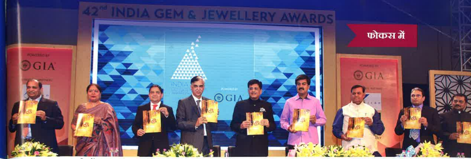
गणमान्य व्यक्तियों का अनावरण रत्न संघीका