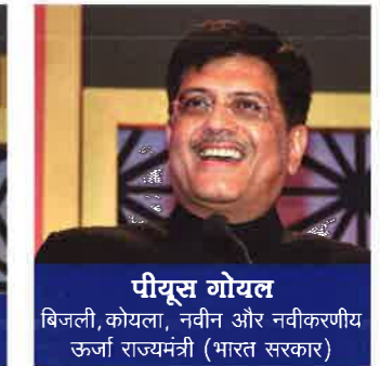
पीयूश गोयल विजली, कोयला, नवीन और नवीकरणीय ऊर्जा राज्यमंत्री (भारत सरकार)