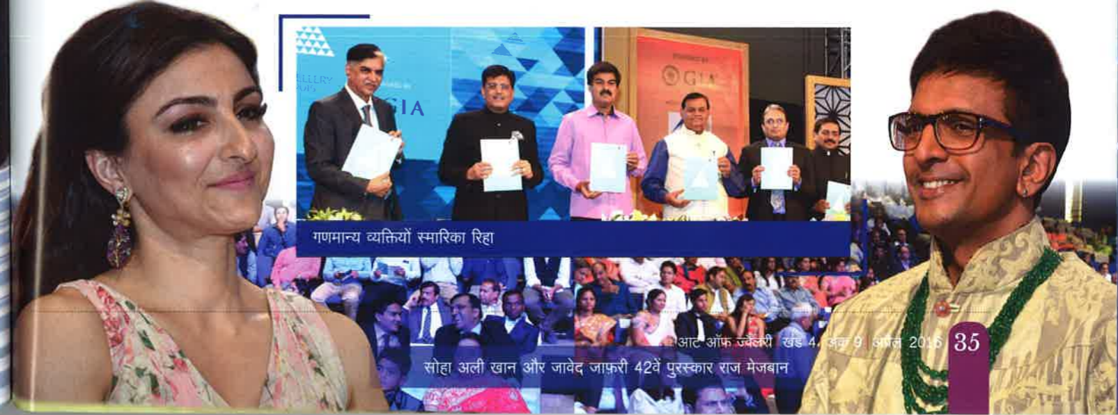
गणमान्य व्यक्तियों स्मारिका रिहा